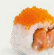
Hot Spicy Shake