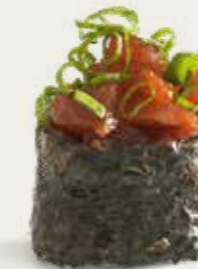
Spicy Maguro Gunkan