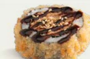
Big Buddhas Roll