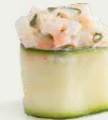
Ebi Sarada Gunkan