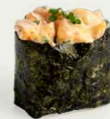
Shake Classic Gunkan