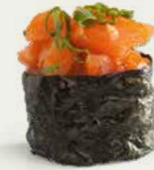
Spicy Shake Gunkan