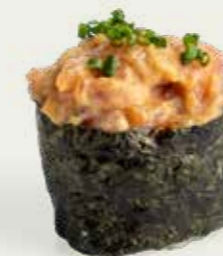
Maguro Classic Gunkan