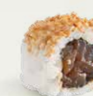
Hot Spicy Maguro